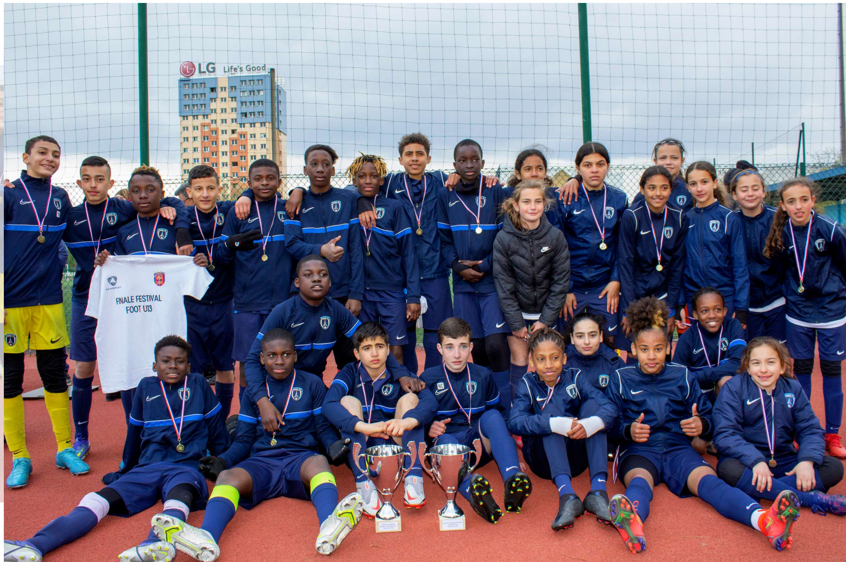
Les équipes Paris FC, vainqueurs de la compétition.

Après cette superbe journée de football, le District de Paris souhaite remercier tous les acteurs ayant participé à l'organisation de cette journée. Un grand merci aux commissaires, aux encadrants bénévoles, aux arbitres et ainsi qu'aux membres du comité directeur présents.