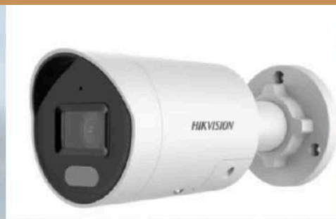
Caméra bullet HIKVISION Vision de nuit 60m Full HD de jour comme de nuit Muni d'une IA Sirène et flash lumineux