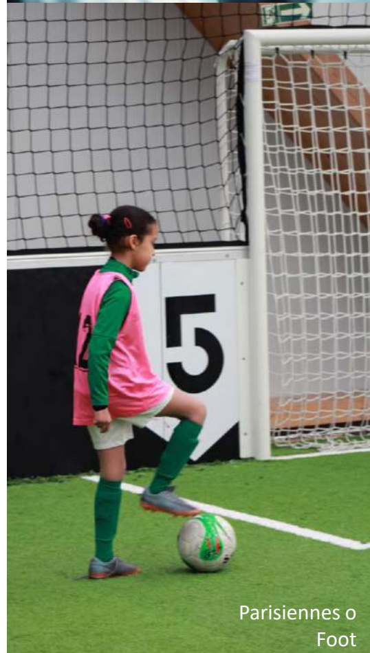
Parisiennes o Foot