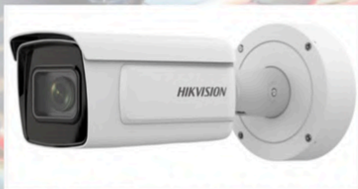
Caméra Bullet IP 4MP Deepview Imagerie de haute qualité Excellentes performances en basse lumière Image claire en cas de fort contre-jour Reconnaissance des plaques d'immatriculation

Système de vidéoprotection à lecture de plaques d'immatriculation