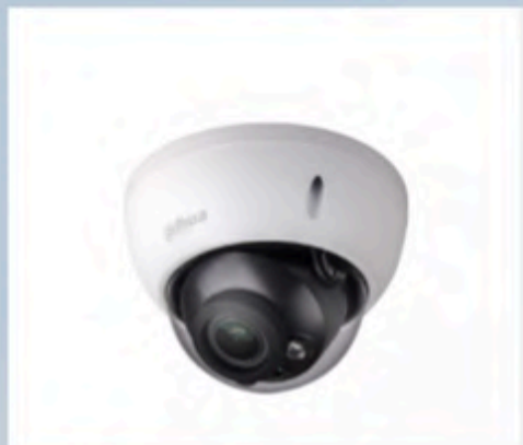
Caméra DAHUA mini dôme Caméra intelligente détection de visage Distance jusqu'à 30m Compatible avec IOS & Android