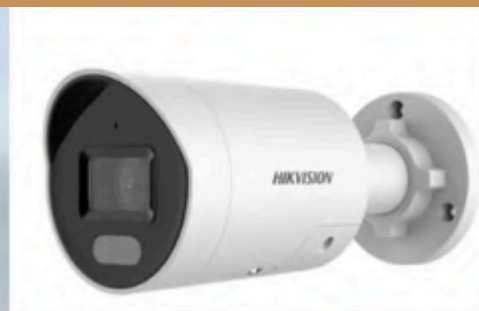
Caméra bullet HIKVISION Vision de nuit 60m Full HD de jour comme de nuit Muni d'une IA Sirène et flash lumineux