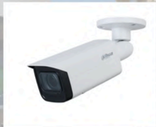
Caméra DAHUA bullet Image haute définition Surveillance intelligente Indice de protection IP67