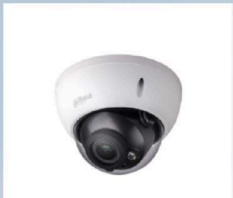
Caméra DAHUA mini dôme Caméra intelligente détection de visage Distance jusqu'à 30m Compatible avec IOS & Android