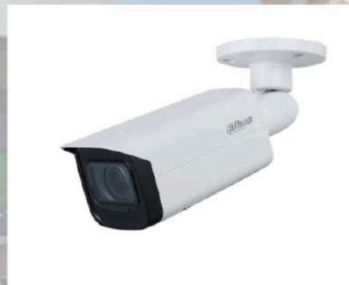
Caméra DAHUA bullet Image haute définition Surveillance intelligente Indice de protection IP67