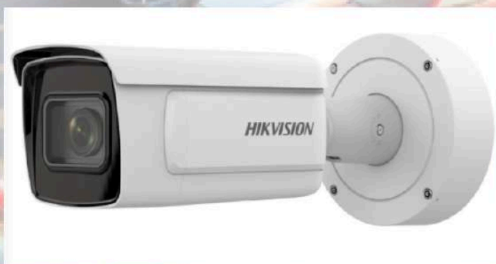
Caméra Bullet IP 4MP Deepview Imagerie de haute qualité Excellentes performances en basse lumière Image claire en cas de fort contre-jour Reconnaissance des plaques d'immatriculation

Système de vidéoprotection à lecture de plaques d'immatriculation