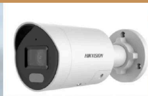
Caméra bullet HIKVISION Vision de nuit 60m Full HD de jour comme de nuit Muni d'une IA Sirène et flash lumineux