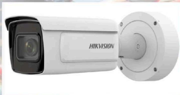
Caméra Bullet IP 4MP Deepview Imagerie de haute qualité Excellentes performances en basse lumière Image claire en cas de fort contre-jour Reconnaissance des plaques d'immatriculation

Système de vidéoprotection à lecture de plaques d'immatriculation