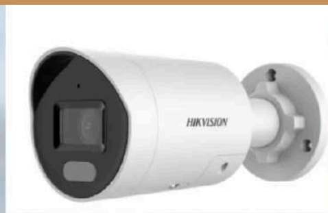
Caméra bullet HIKVISION Vision de nuit 60m Full HD de jour comme de nuit Muni d'une IA Sirène et flash lumineux