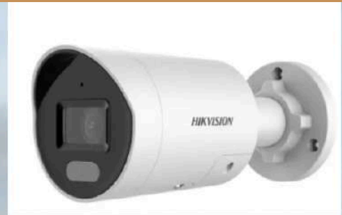
Caméra bullet HIKVISION Vision de nuit 60m Full HD de jour comme de nuit Muni d'une IA Sirène et flash lumineux