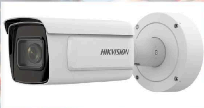
Caméra Bullet IP 4MP Deepview Imagerie de haute qualité Excellentes performances en basse lumière Image claire en cas de fort contre-jour Reconnaissance des plaques d'immatriculation

Système de vidéoprotection à lecture de plaques d'immatriculation