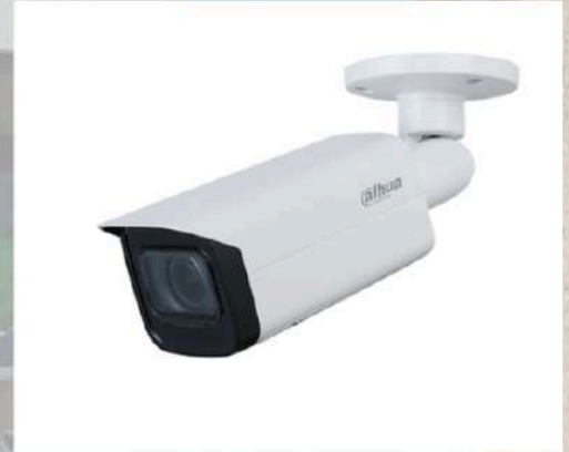
Caméra DAHUA bullet Image haute définition Surveillance intelligente Indice de protection IP67