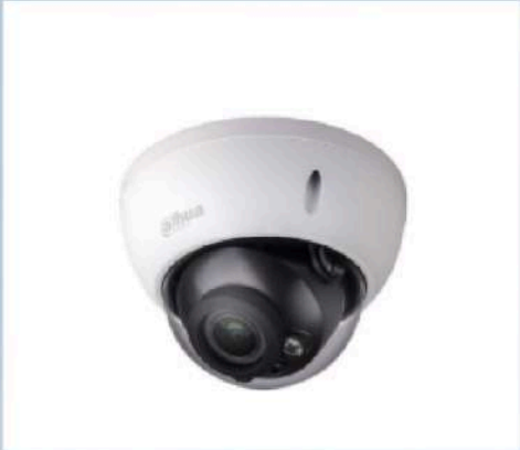
Caméra DAHUA mini dôme Caméra intelligente détection de visage Distance jusqu'à 30m Compatible avec IOS & Android