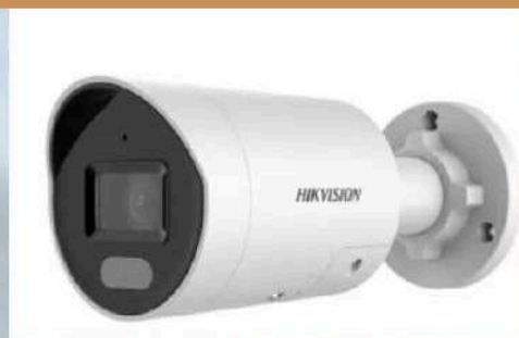
Caméra bullet HIKVISION Vision de nuit 60m Full HD de jour comme de nuit Muni d'une IA Sirène et flash lumineux