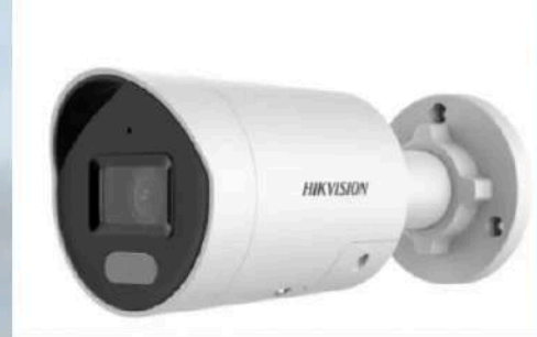
Caméra bullet HIKVISION Vision de nuit 60m Full HD de jour comme de nuit Muni d'une IA Sirène et flash lumineux